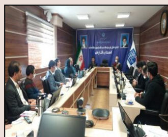
جلسه پایش سایبری دستگاههای فاقد طبقه بندی و و غیرزیرساختی استان فارس