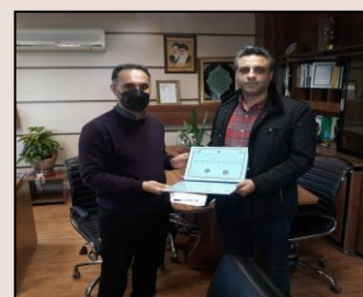
اعطای گواهینامه افتا به شرکت فنی مهندسی پارس معیار جنوب در حوزه خدمات عملیاتی افتا گرایش پیاده سازی امنیت فیزیکی و محیط پیرامونی