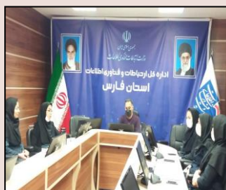
جلسه مشاورین امور بانوان و خانواده وزارت به صورت ویدیو کنفرانس