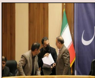
شرکت در جلسه شورای راهبری توسعه مدیریت استان فارس