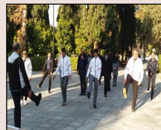
شرکت همکاران در ورزشهای همگانی با حضور متولیان این بخش در اداره کل ورزش و جوانان استان فارس