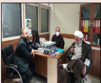
بررسی مشکلات ارتباطی شهر اشکنان شهرستان لامرد با حضور امام جمعه و بخشدار اشکنان