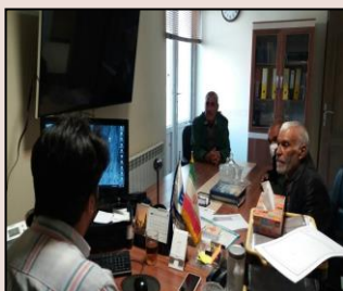
بررسی مشکلات ارتباطی روستاهای استان با حضور اهالی و مسئولان روستا