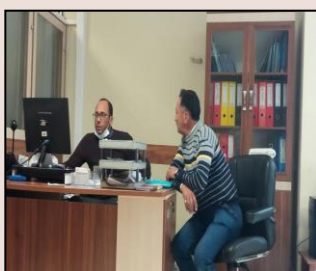
بررسی مشکلات ارتباطی روستاهای استان با حضور اهالی و مسئولان روستا