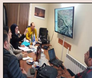
جلسه با کارشناسان حوزه طراحی فیبر مخابرات در خصوص طراحی فیبرهای مسیرهای جدید ترانسمیشن سایت های در برنامه