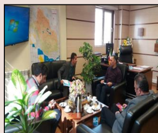
دیدار با اعضای شورای بخش سیمکان شهرستان جهرم